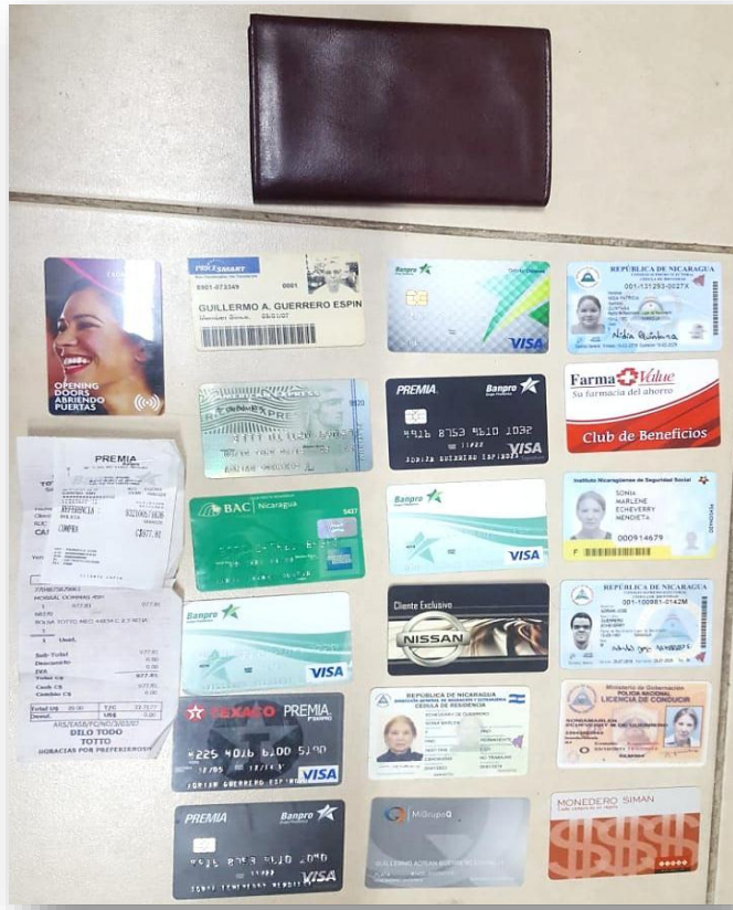
Tarjetas de créditos y débito