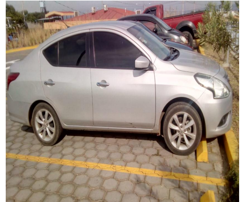
Automóvil marca Nissan, placa M-218-556.