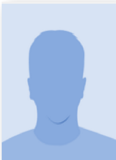
Adolescente E.S.R.M Alias «Chatarrito» y

Registra antecedentes delictivos de Robo con Intimidación (asalto) y Tráfico de Drogas.