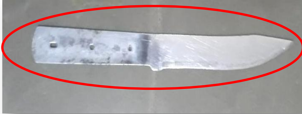
1 arma cortopunzante (cuchillo)