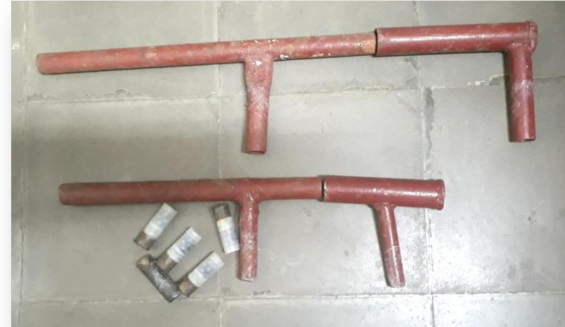
2 armas de fuego artesanales, aptas para el disparo de unidad de munición para escopeta calibre 12.

Peritaje biológico realizado por peritos de criminalística, reveló coincidencia del tipo de sangre de la víctima Darwin Antonio Benavidez Reyes , con manchas de sangre encontradas en arma cortopunzante (cuchillo).