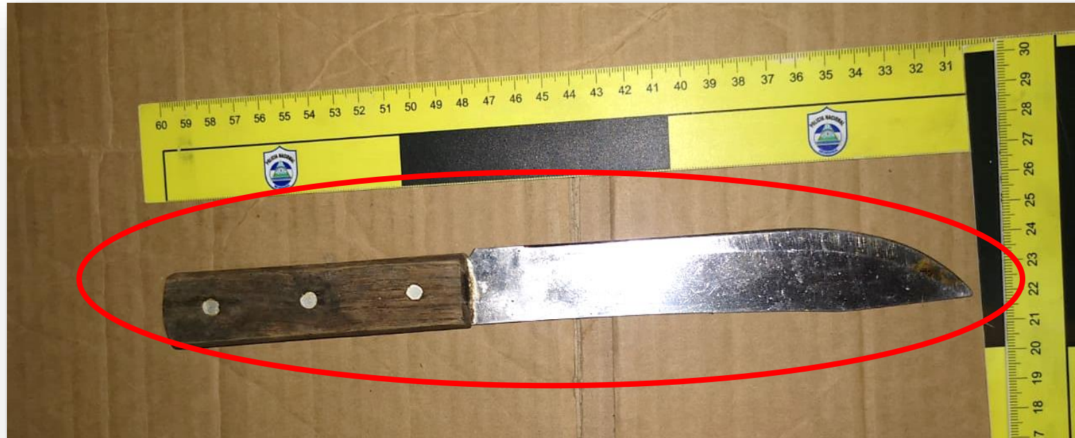
Arma cortopunzante (cuchillo)