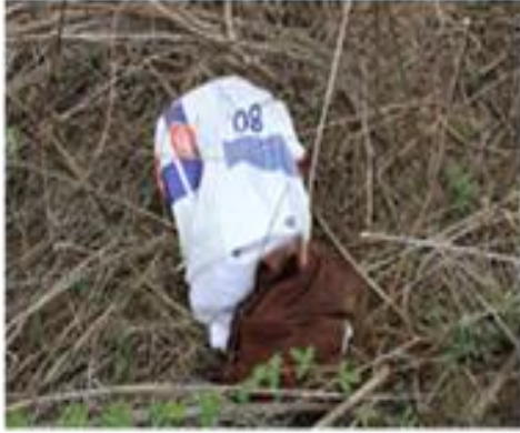
Mochila y saco macen con ropa de la víctima.