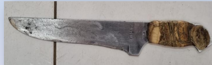
Arma cortopunzante (cuchillo) Utilizado para cometer el crimen