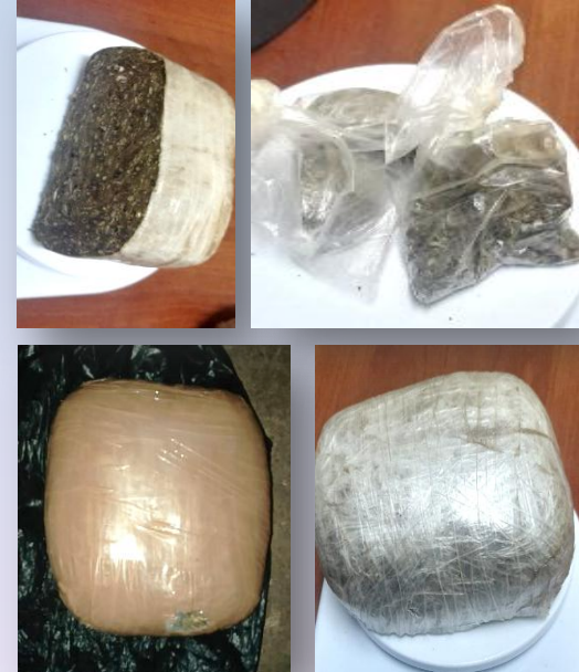
3 libras de marihuana