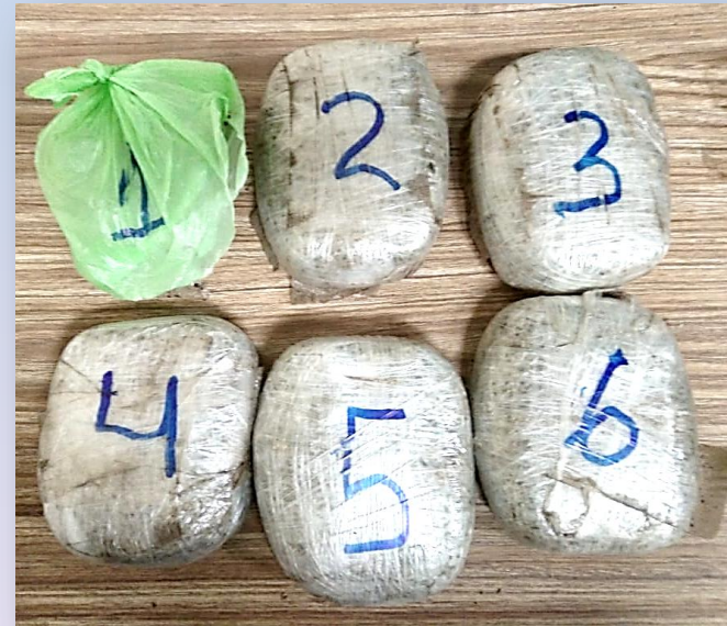
4 Libras de marihuana