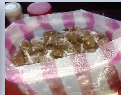
2 Libras de marihuana