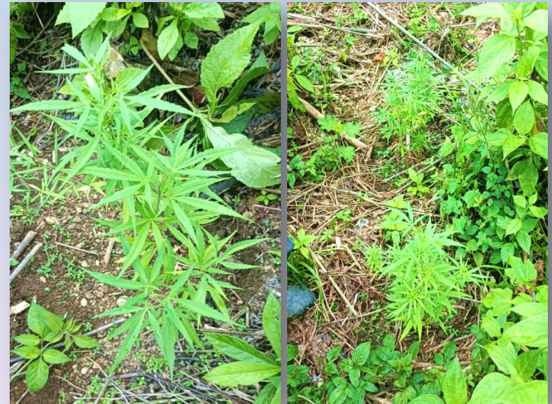
42 plantas de marihuana