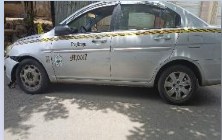
Automóvil placa M 10017