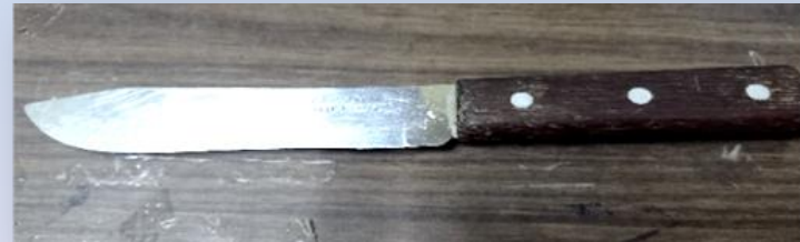
Arma cortopunzante (cuchillo) Utilizada para cometer delito