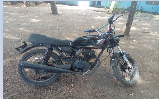
Motocicleta, utilizada para desplazarse y cometer delito.