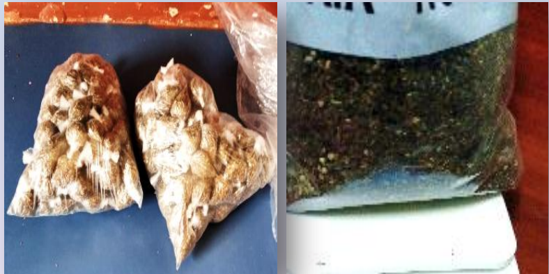
1 libra de marihuana