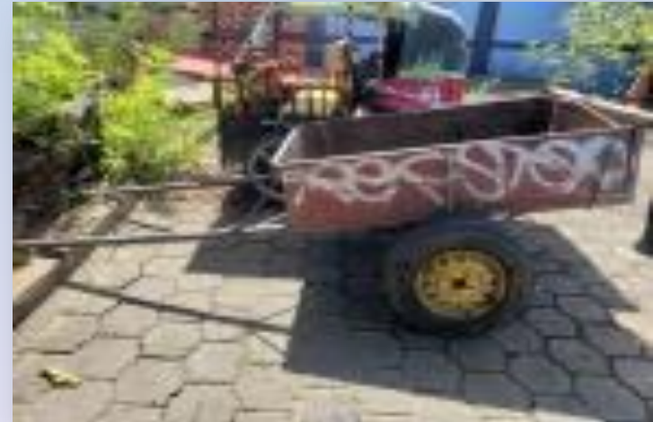
Carretón de tracción animal utilizado para desplazarse y cometer delito.