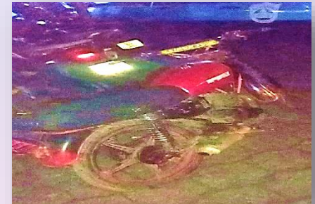
Motocicleta utilizada para desplazarse