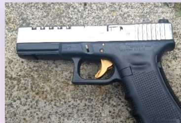
Arma de fuego (pistola) utilizada para cometer el delito