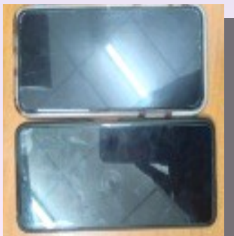
2 Teléfonos celulares.