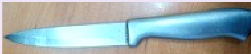
Arma cortopunzante (cuchillo) Utilizada para intimidar