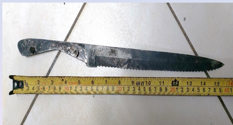
Arma blanca (cuchillo) utilizada para cometer el delito.