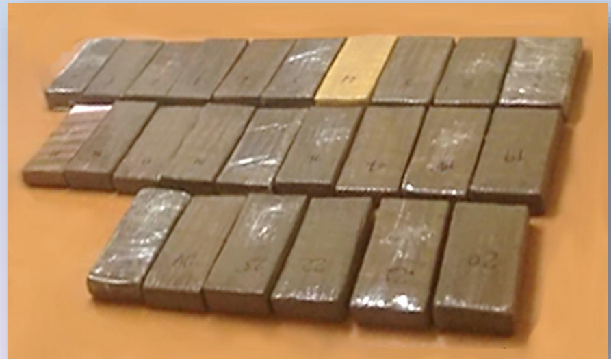
26 kilos con 701 gramos de cocaína