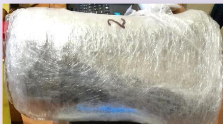
5 libras de marihuana