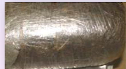
1 libra de marihuana