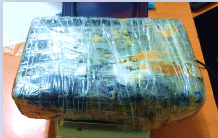
1 kilo con 117gramos de cocaína