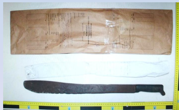
Arma cortopunzante (machete) Utilizado para cometer el crimen