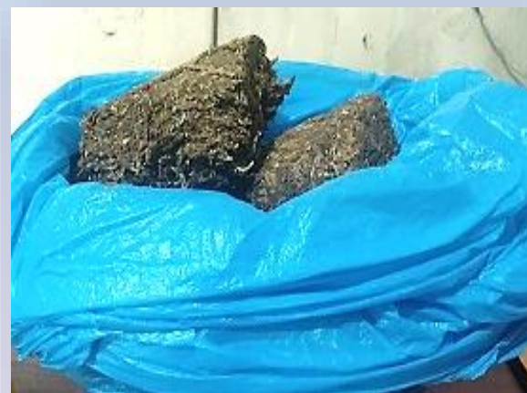
5 libras de marihuana