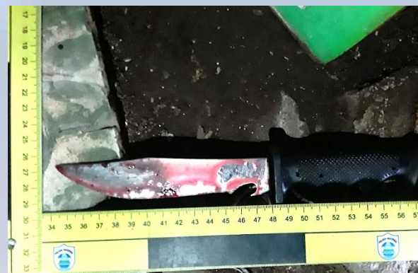
Arma blanca (cuchillo) utilizado para cometer el crimen.