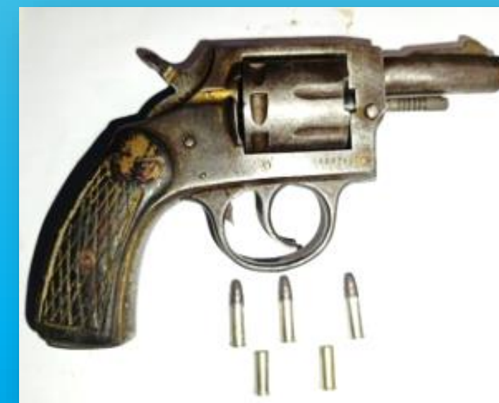
Revólver con 5 unidades de munición