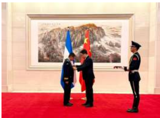
El Primer Comisionado General Francisco Javier Díaz Madriz , Jefe de las Fuerzas Policiales de Nicaragua, recibiendo la condecoración Medalla de Oro Conmemorativa Gran Muralla de parte del hermano Wan Xiaohong , Ministro de Seguridad Pública de la República Popular China.

ción del delito, así como en el fortalecimiento de las capacidades técnicas y tecnológicas para enfrentar el terrorismo, el narcotráfico y el ciberdelito.